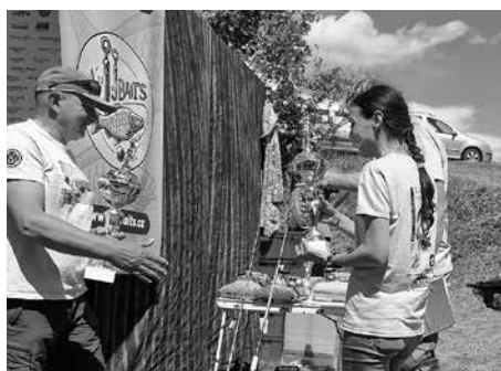
Výběr cen za umístění je zlatým hřebem každých závodů