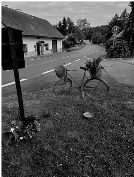
Květinová výzdoba asi někoho silně rozčiluje...