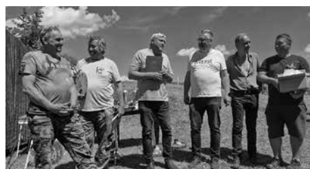
Partnerský rybářský spolek z města Niemcza s naším výborem MO Letohrad s předáním pamětního listu za dosavadní spolupráci mezi oběma organizacemi