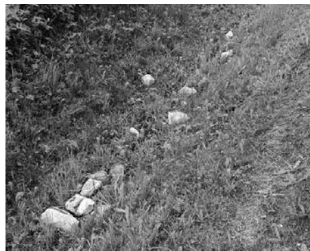
Prosíme zemědělce, aby kameny z pole neházeli do příkopů nebo ke stromům v alejích podél polí. Obci pak při sečení příkopů vznikají škody na technice.