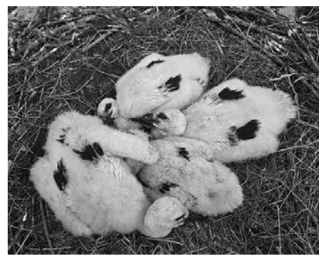
Na karosárně byly instalovány hromosvody, ale jeden ještě chybí. Asi tušíte, že je to ten na komíně, kde se uhnízdili čápi. Zatím je vyrušilo jen kroužkování ornitologa, my s hromosvodem počkáme a dopřejeme jim klid.