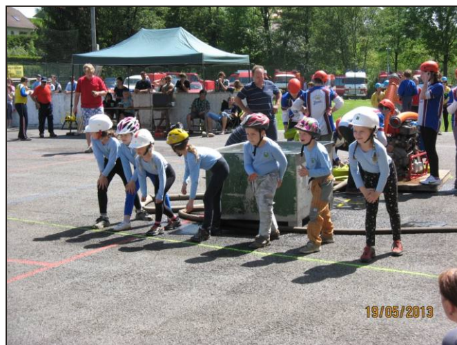
Přes 300 mladých hasičů zaplnilo v neděli 19. května areál u sokolovny a soutěžilo O pohár obce Lukavice. Pořadatelsky náročnou akci se podařilo hasičům zvládnout ke spokojenosti soutěžících i diváků.