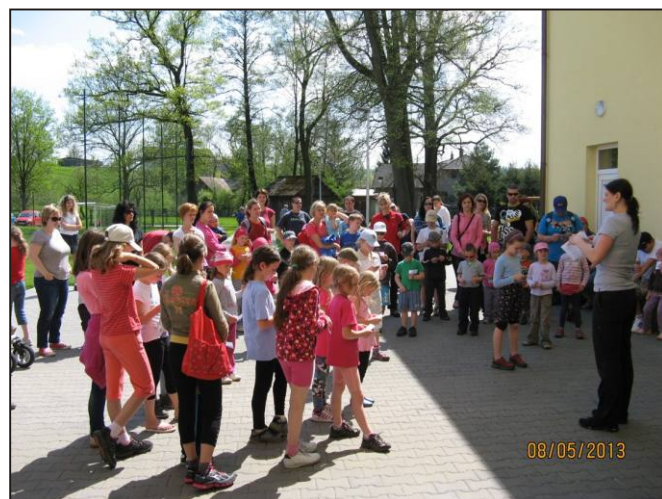
Slunečné počasí svátečního 8. května využily děti k účasti na Sportovní akademii, kterou pro ně uspořádala T.J.Sokol.