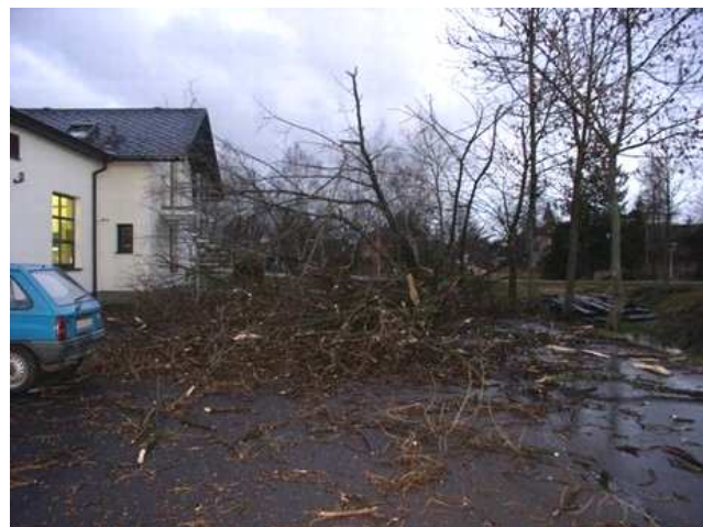
Výsledek řádění orkánu Kyril v Lukavici

Zpracoval: prap.Ing František Vychytil – inspektor