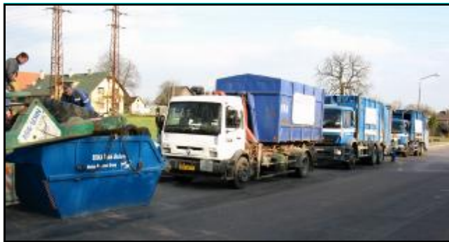
flotila vozů Ekoly při svozu v Lukavici

Děkujeme všem, kteří důsledně třídí své odpady.