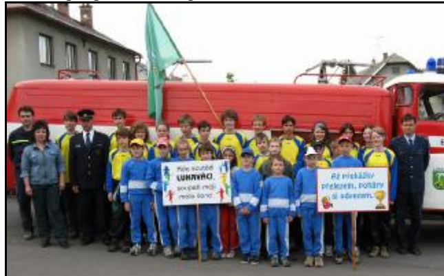
Mladí hasiči při oslavách svátku sv.Floriána

SDH Lukavice pořádá při příležitosti 125. výročí založení SDH Lukavice dne 26. května 2007 I. ročník soutěže mladých hasičů O pohár obce Lukavice, který se započítává do Ligy požárního útoku (Orlickoústecká liga). Začíná se v 10,45 zahájením a slavnostním nástupem, od 11,00 hod. bude zahájena soutěž. Po skončení soutěže volná zábava (diskotéka). Občerstvení zajištěno. Přijďte fandit a podpořit naše úspěšné mladé hasiče!