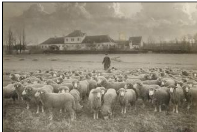
Lukavský dvůr – konec 19. století

V r.1710 byl na panství zaveden nový plat (daň) „czergelt“ 3 krejc. 3 den., platili sedl. v Kyšperku, Jank., Rotneku, Lukavici , Šedivci, Nekoři, Vlčkovcích, Čes.Petrovicích, Celném, Těchoníně, Sobkovicích, Lubníku a Mistrovicích. Tedy vesnicích zapsaných ve starém urbáři předbělohorském. Vesnice bývalého statku Orlice tento plat neměli. Celkem činil roční plat 10 zl.13 kr.