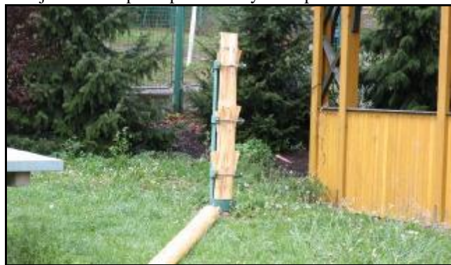
Pahýl, který zůstal z májky. Vršek najdete u kostela

ale někdo za nás řekl ne, a májku skácel sám v noci 5.května. V nedělní pouťové ráno jsme našli májku na hřišti rozřezanou, věnec byl pohozený u kostela...Co dodat? Snad jen doufat, že sokolové nezahořknou a tradici stavění máje zachovají i nadále. Že najdou někoho kdo zdarma májku věnuje, ve volném čase ji půjdou jedno odpoledne do lesa pokácet, druhé odpoledne ji očistit, ozdobit, nakoupit občerstvení a čekat, že možná někdo přijde na pálení čarodějnic a také to stavění máje. Třeba jako letos, 50 lidí... Kde jsou ti co si stěžují, že se tu nic neděje? S tímto přístupem to brzy bude pravda.