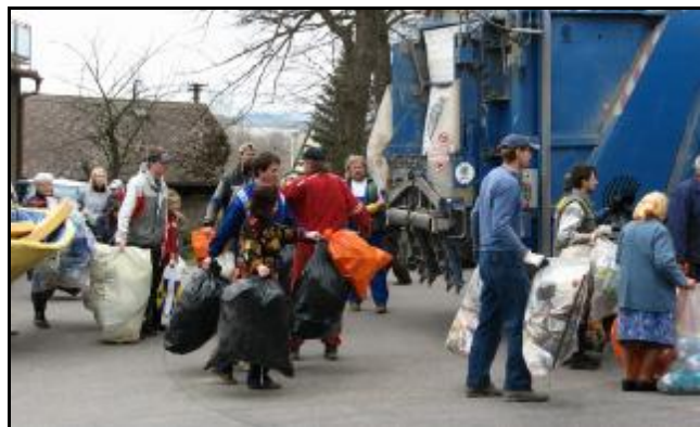
svoz odpadů na stanovišti u kostela

Vytříděné sklo se rozdrťí a přidává do výchozí směsi na výrobu nového skla. Díky tomu se šetří nejen mnoho energie, ale také surovin. Největší výhodou je, že se sklo dá roztavit opakovaně, čímž je zajištěna neomezená možnost recyklace.