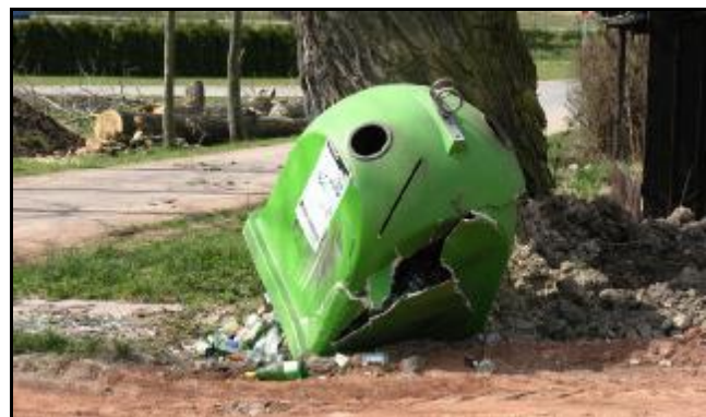
Takto skončil kontejner na sklo na dolním konci po setkání s neopatrným řidičem. Škoda činí 12 tis Kč.

www.ekokom.cz www.jaktridit.cz www.tonda-obal.cz