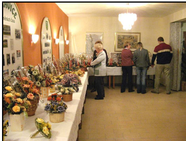
Výstava suchých vazeb