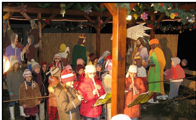
Rozsvícení vánočního stromu u nového betlému