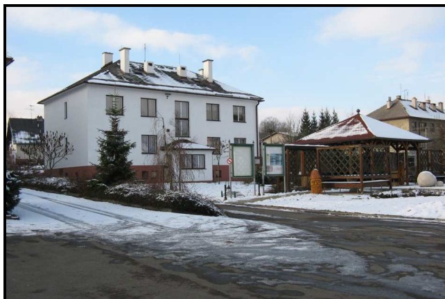
Nový kabát lukavské návsi