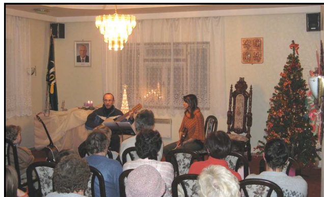
Předvánoční koncert Duo-Žuk

Jako první bych změnil rozhlas. Ubral bych trochu dechové hudby a promíchal to s trochou hudby z nové generace. K rozhlašování zpráv nic nemám. Potom by se mi líbilo dát na hřiště za sokolovnou umělý trávník. Pořád je tam bláto a nedá se tam dobře sportovat. Moc se mi líbí zastávka u Obecního úřadu, protože ta stará nebyla příliš hezká. Kdyby to bylo možné, postavil bych stejnou zastávku ve směru na Žamberk. Také bych chtěl změnit chodníky do Žamberka. Jelikož tam žádné nejsou je to docela nebezpečné. Lidé hodně chodí do Žamberka pěšky, a když kole Vás jezdí auta je to docela nepříjemné. Ještě k tomu rozhlasu. Že by se hrála dechová hudba v pondělí a novější rockové skupiny v úterý atd. Lukavice je jinak velmi pěkná vesnice. Sokolovna byla na plese velmi pěkná, ale jen zevnitř. Chtělo by to postavit a nebo, vylepšit sokolovnu, protože působí jako velmi neutrální budova. Nic jiného nemám.