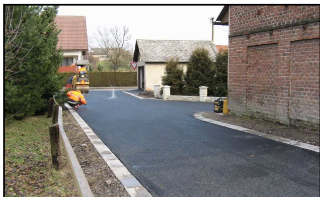
Nová asfaltka k Jamallu