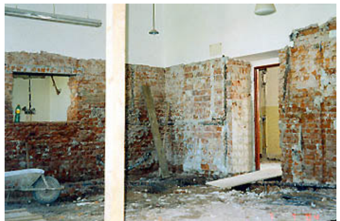
Poznáváte školní kuchyň?