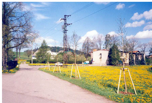
Cestou k jídelně „potkáte“ 6 nově vysazených bříz